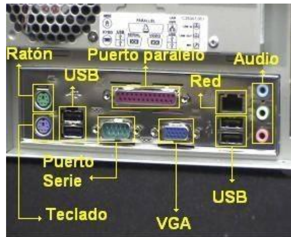
Fig 13 Conectores externos