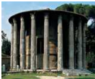
Templo de Vesta

http://mercedesitalia95.wordpress.com/2011/12/30/66/