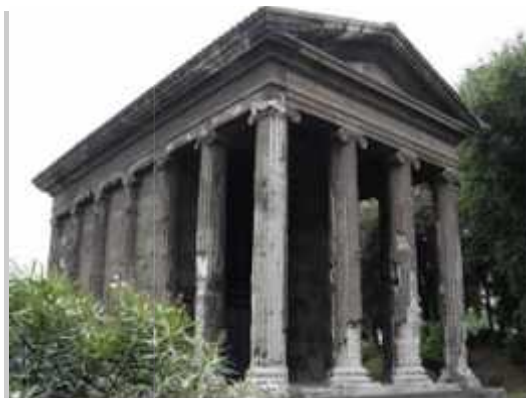
ITemplo de Protunus o Mater Matuta