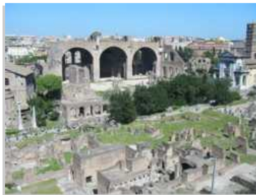
Cabañas del Palatino