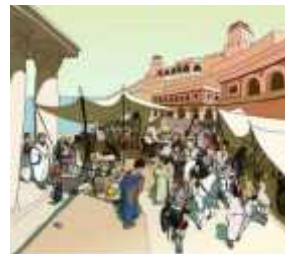
Mercado en la Antigua Roma

llevar. Ahí se paraba la gente más humilde junto a los viajeros, donde muchas veces comían en la calle de pie. Eran sitios impropios de las clases acomodadas. Debemos tener presente que la gente que tenía dinero sí que podía comer tranquilamente en su casa, donde les preparaban y servían la comida. Pero era en la calle donde transcurría la acción de la vida romana. Para los ciudadanos más humildes la jornada terminaba después de la cena, justo antes de ir a dormir.