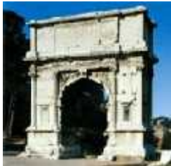
Arco de triunfo

Para saber + Los arcos de triunfo eran contruidos para los desfiles de las tropas vencedoras. Se dedicaban a generales o emperadores victoriosos. Se situaban principalmente en los foros.