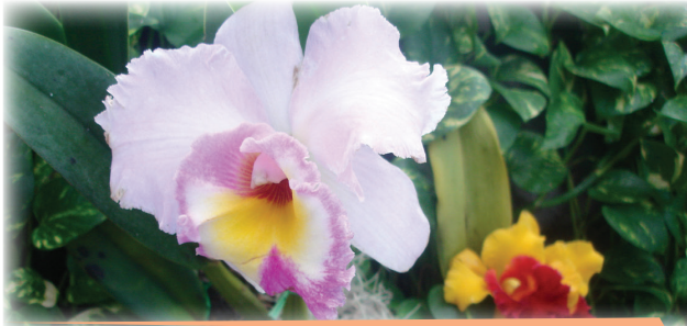
Plantas ornamentales de Guatemala