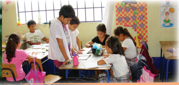
Derechos de los niños y de las niñas